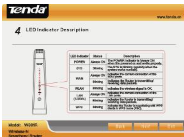
Obr. 1.6 – Tabulka indikace LED diod