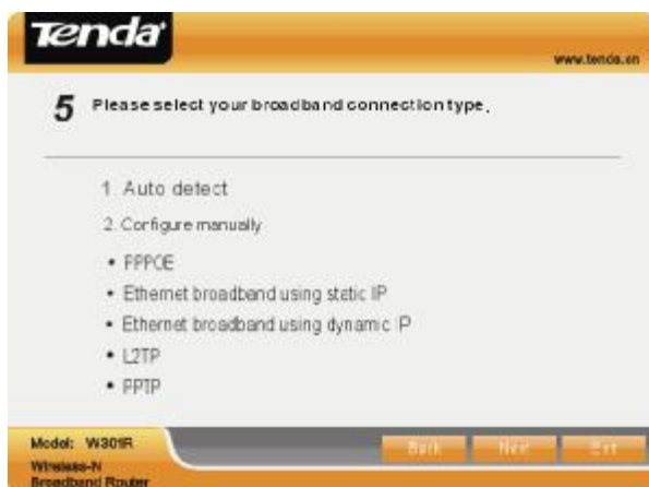
Obr. 1.8 – Výběr připojení k Internetu