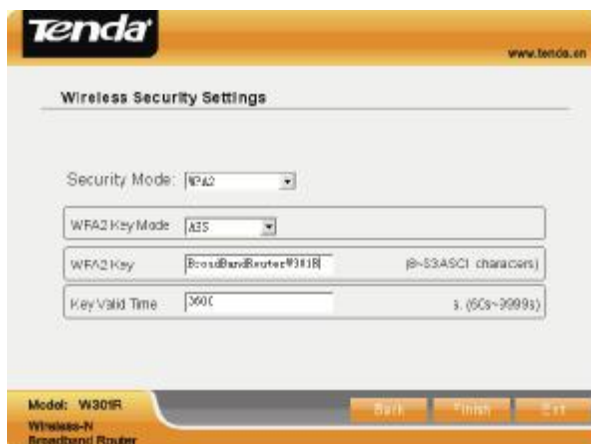
Obr. 1.11 – Nastavení zabezpečení bezdrátové sítě

nedoporučuje používat! Položku Key Valid Time můžete ponechat beze změny. Po úspěšném nastavení klikněte na tlačítko Finish.