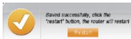
Obr. 1.12 – Úspěšné uložení nastavení a informace o restartu zařízení