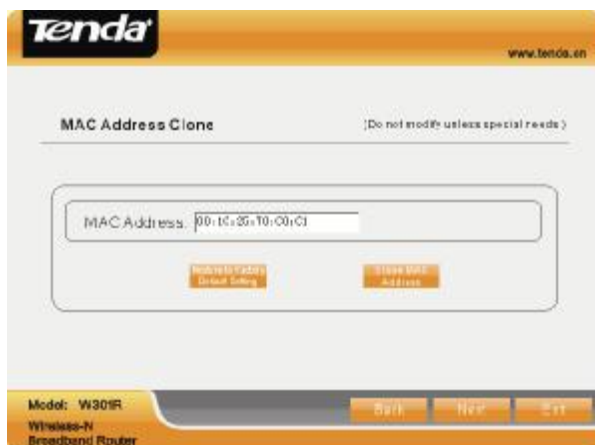
Obr. 1.9 – Nastavení klonování MAC adresy