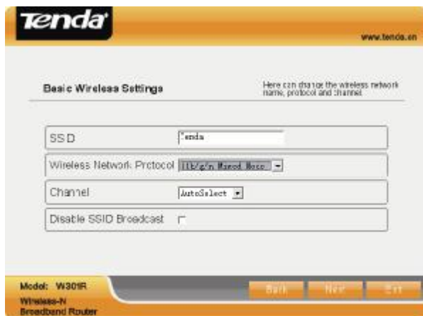
Obr. 1.10 – Nastavení bezdrátové sítě