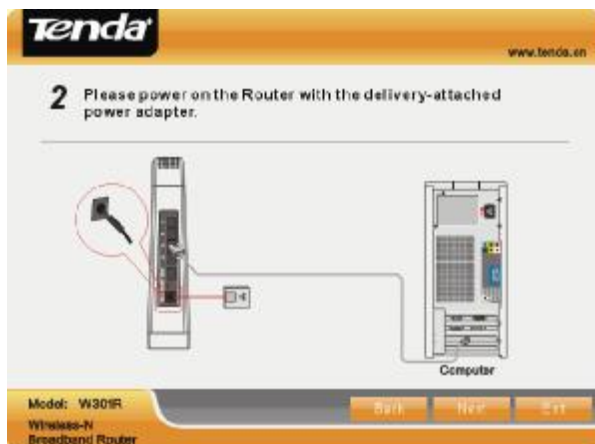
Obr. 1.4 – Připojení napájecího adaptéru