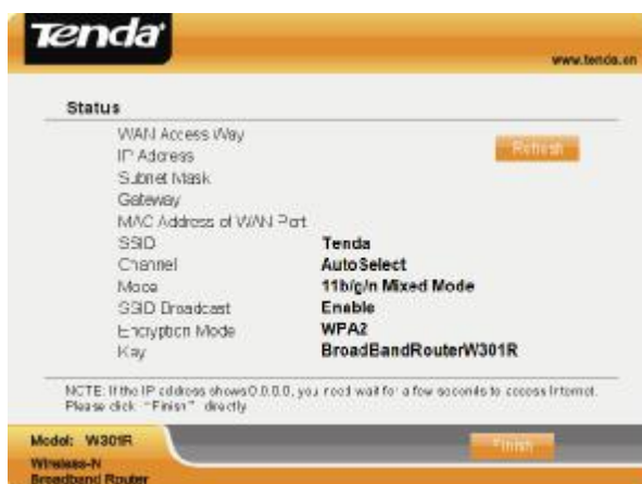
Obr. 1.13 – Podrobné informace o konfiguraci