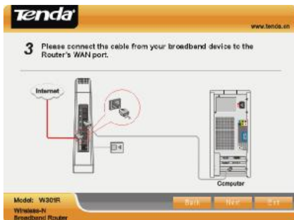
Obr. 1.5 – Při pojení konektivy od poskytovatele Internetu