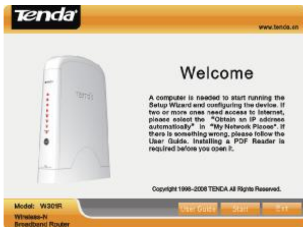
Obr. 1.1 – Úvítací obrazovka