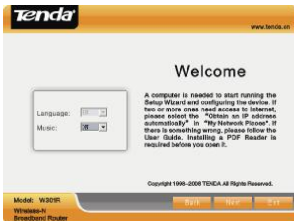
Obr. 1.2 – Volba jazyka a doprovodných zvuků